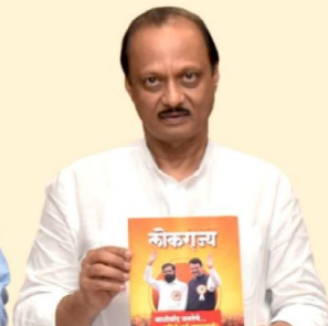
अजित पवार उपमुख्यमंत्री