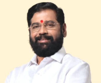
एकनाथ शिंदे मुख्यमंत्री