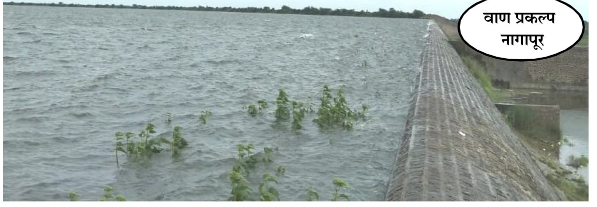
वाण प्रकल्प नागापूर

ठिकाणची छोटे, मोठे तलाव भरण्यासाठी मोठ्या, मुसळधार पावसाची आवश्यकता आहे. दरम्यान, परळी शहरास सध्या आठवड्यातून एक वेळा पाणी पुरवठा होतो. वाण प्रकल्प भरल्याने दोन ते तीन दिवसांनी परळी पालिकेने शहरास पाणीपुरवठा करावा अशी मागणी येथील नागरिकांची आहे. ****