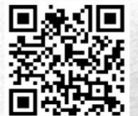
योजनेच्या नोंदणीसाठी येथे स्कॅन करा