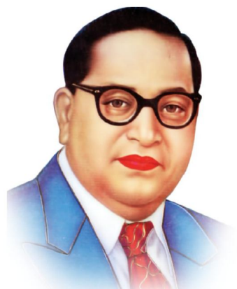
मांडले आहेत. परंतु ते विचार इतरांपेक्षा वेगळे आहेत.

समर्थपणे पार पाडावीत असे शिक्षण असावे. शाळा म्हणजे उत्तम नागरिक व कर्तव्यदक्ष नागरिक बनविणारे कारखाने आहेत. याचे भान या प्रक्रियेत भाग घेणाऱ्यांनी घ्यावे. पीपल्स एज्युकेशन सोसायटीची स्थापन १९४६ साली करून त्यांनी मुंबईला सिद्धार्थ कॉलेज व औरंगाबादला मिलिंद महाविद्यालय सुरू केले. राष्ट्रहित व समाजहिताचे भान ठेवणारेच खरे शिक्षण होय असे ते मानित. राजकीय विचार:- डॉ. बाबासाहेब आंबेडकरांचे राजकीय विचार म्हणजे स्वराज्य, राष्ट्रवाद, लोकशाही, मूलभूत हक्क, अल्पसंख्यकांचे हितरक्षण, समाजवाद, साम्यवाद, बौद्ध धर्म इत्यादी संबंधीची विचार होते. डॉ. आंबेडकरांनी भारतातील विविध राजकीय प्रश्नांबंधी आणि राजकीय तत्त्वज्ञानासंबंधीची मते आपल्या अनेक लेखातून, पुस्तकातून आणि भाषणांतून मांडली आहेत. तेच बाबासाहेबांचे राजकीय विचार आहेत. डॉ. आंबेडकरांचे काही राजकीय विचार हे त्यांनी घटना परिषदेच्या अधिवेशनात केलेल्या भाषणातूनही व्यक्त झालेले आहेत. डॉ. बाबासाहेब आंबेडकरांच्या या विचारांचा तत्कालीन राजकारणावर तसेच स्वातंत्र्याच्या राजकारणावर प्रभाव पडला आहे. स्वराज्यासंबंधी विचार:- ब्रिटिश काळात सर्वच भारतीय राजकीय नेते आणि विचारवंतांप्रमाणे डॉ. बाबासाहेब आंबेडकरांनी सुद्धा स्वराज्यासंबंधीचे विचार