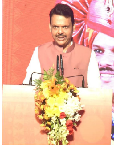
उद्योगमंत्री चिराग पासवान, उत्तर प्रदेशचे मुख्यमंत्री योगी आदित्यनाथ, आंध्रप्रदेशचे मुख्यमंत्री चंद्राबाबू नायडू, बिहारचे मुख्यमंत्री नितीश कुमार,

शाह, केंद्रीय आरोग्य मंत्री जगतप्रकाश नड्डा, केंद्रीय भूपृष्ठ परिवहन व महामार्ग मंत्री नितीन गडकरी, केंद्रीय कृषि मंत्री शिवराजसिंह चौहान, केंद्रीय अर्थमंत्री निर्मला सीतारामन, केंद्रीय वाणिज्य व उद्योगमंत्री पियुष गोयल, केंद्रीय परराष्ट्र व्यवहार मंत्री डॉ एस जयशंकर, केंद्रीय पर्यावरण मंत्री भूपेंद्र यादव, केंद्रीय माहिती तंत्रज्ञान व रेल्वे मंत्री अश्विनी वैष्णव, केंद्रीय अवजड उद्योगमंत्री एच डी कुमारस्वामी, केंद्रीय शिक्षणमंत्री धर्मेन्द्र प्रधान, केंद्रीय सूक्ष्म मध्यम लघू उद्योगमंत्री जितनराम मांझी, केंद्रीय दळणवळण मंत्री जोतिरादित्य सिंधिया, केंद्रीय संसदीय कार्यमंत्री किरेन रिजिजू, केंद्रीय मत्स्य व्यवसाय व पशुसंवर्धन मंत्री राजीव रंजन सिंह, केंद्रीय अन्न प्रक्रिया